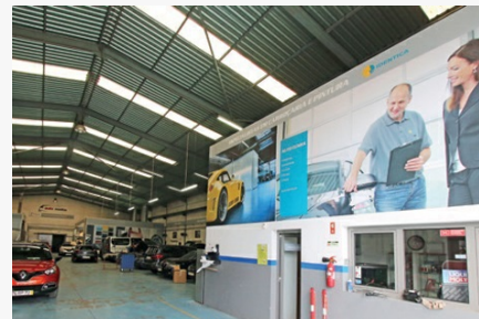
IDENTICA Auto Cunha

Refira-se que apesar da enorme especialização da oficina no setor da repintura, na Auto Cunha também se faz alguma mecânica rápida.