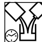
Tabla de combinaciones para diferentes niveles de brillo

Dependiendo el nivel de brillo requerido se puede usar la siguiente tabla para la mezcla de transparentes.