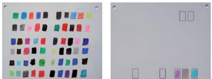
60 colori testati prima della pulizia