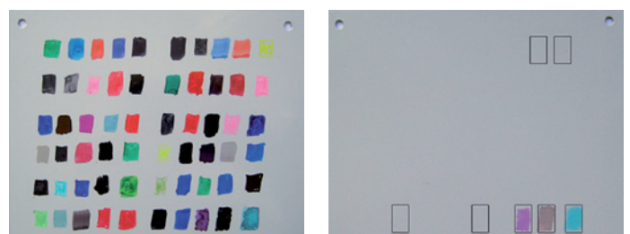
60 couleurs avant et après 15 cycles de graffitage et nettoyage